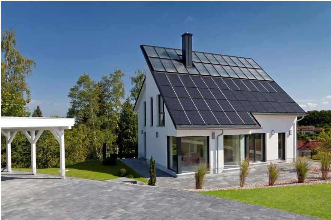
➤ Abb.: Als erste Bank Deutschlands baut die VR-Bank Altenburger Land eG 2016 in Schmölln ein vernetztes energieautarkes Haus. Es soll eine neue Art der Altersvorsorge demonstrieren: die Investition in steuerfreie Einsparungen (Kosten für Wohnen, Wärme, Strom und E-Mobilität entfallen im Alter nach Abzahlung des Hauses)

Für Banken stellen diese Gebäude eine attraktive und sichere Rendite dar. Ein Beispiel ist die VR Bank Altenburger Land eG, die als erstes Finanzinstitut Deutschlands in der Stadt Schmölln ein energieautarkes Gebäude baut. Sie will dies nicht verkaufen, sondern selbst nutzen und vermieten.