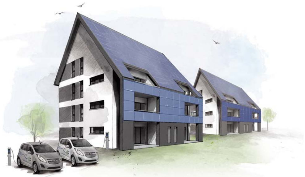
➤ Abb.: Miete mit Energieflat: Zwei energieautarke Mehrfamilienhäuser mit je 7 Wohneinheiten in Cottbus, Baubeginn 2017. 100 m 2 Solarthermie mit 25 m 3 Langzeitwärmespeicher sowie 30 KWP Photovoltaik auf dem Dach und an den Balkonen mit 54 kWh Akku erreichen zwischen 65 und 77 solare Deckung bei Strom und Wärme. Der Vermieter kann dem Mieter für mehrere Jahre eine Pauschalmiete anbieten, in der Wohnen, Wärme, Strom und E-Mobilität als Flatrate bereits enthalten ist.

Über das tatsächliche Interesse an der Grundversorgung mit Wärme, Strom und Mobilität hinaus ergeben sich auch für Mieter weitere Vorteile: Das Modell kommt älteren Menschen entgegen, die im Hinblick auf ihre Renten nach Kostensicherheit streben, wie auch jüngeren Menschen mit Familie. Permanente Vergleiche komplizierter Kostengefüge von Stromanbietern entfallen ebenso wie der stete Blick auf die Tankuhr sowie „böse“ Überraschungen im Zusammenhang mit Nebenkostenabrechnungen.